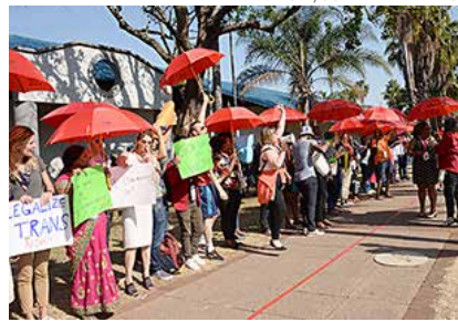
Des membres de NSWP manifestent pour la décriminalisation du travail du sexe en Afrique du Sud pendant la Conférence internationale sur le sida.

constitutionnel qui avait, lors de son discours, encensé à tort le modèle suédois et avait critiqué la mise en œuvre de la décriminalisation du travail du sexe en Nouvelle-Zélande.