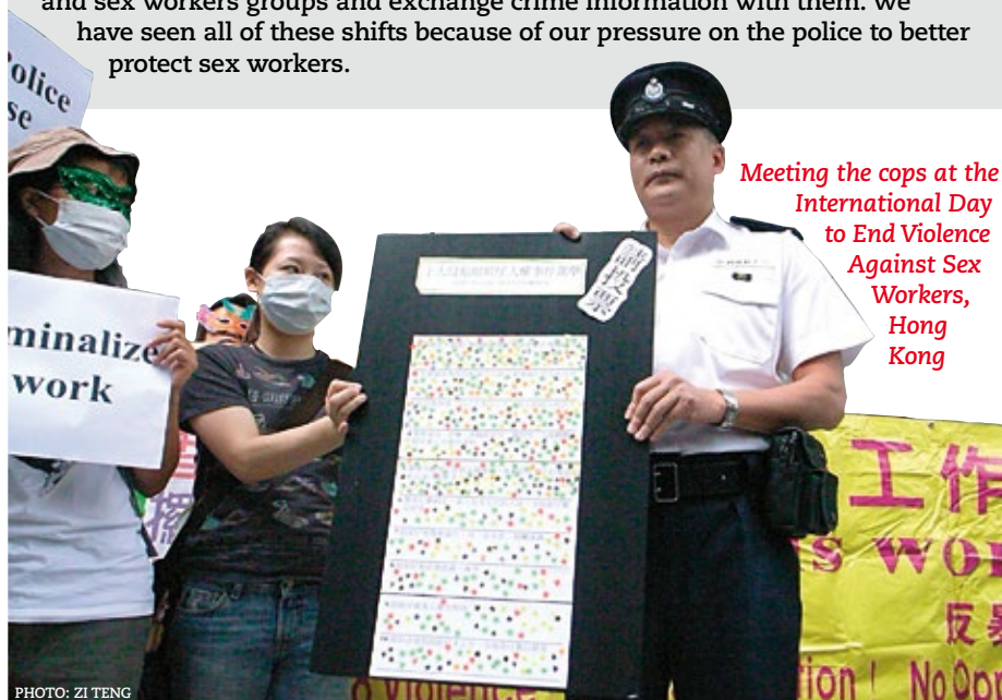
Meeting the cops at the International Day to End Violence Against Sex Workers, Hong Kong

After years of advocacy and negotiation, the police finally did make some changes to their policies towards sex workers. For example, they set up a special taskforce to help sex workers, and produced television programmes and posters to warn criminals who might target sex workers. Police attitudes towards sex workers have also changed: many police officers have stopped insulting sex workers and the police now meet regularly with sex workers and sex workers groups and exchange crime information with them. We have seen all of these shifts because of our pressure on the police to better protect sex workers.