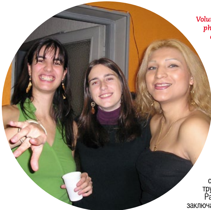
Volunteers of Hetaira: a physician, a social worker and a sex worker

Волонтеры Хетеры: врач, социальный работник и секс- работник