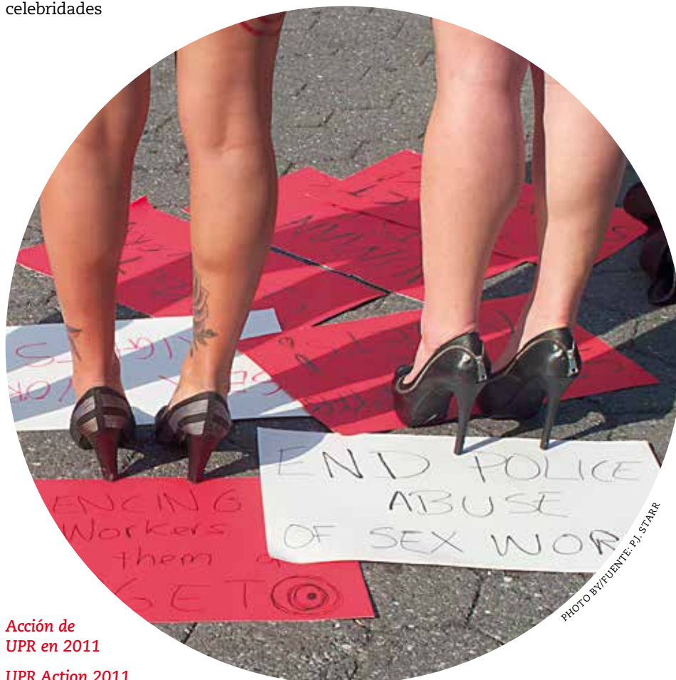
Acción de UPR en 2011

La 'guerra contra el tráfico de seres humanos' en Estados Unidos es la nueva 'guerra contra las drogas', destinada a las personas que ejercen el trabajo sexual, a sus familias y comunidades, obligándolas al trabajo clandestino y alentando a perpetuar la violencia contra las personas que ejercen el trabajo sexual. Esta 'guerra contra las personas que ejercen el trabajo sexual' cuenta con el apoyo de muchísimos recursos, aportados por organizaciones como las fundadas por la familia de Warren Buffett, que han apoyado muchas iniciativas,