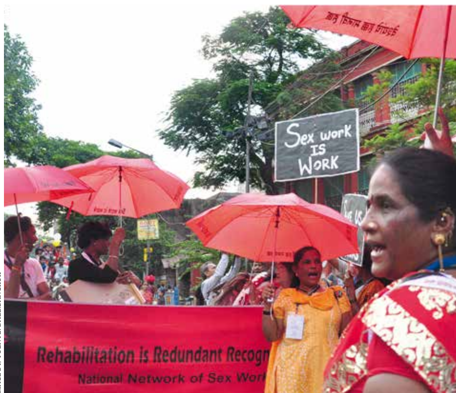
Sex workers marching during the 2012 Sex Worker Freedom Festival in Kolkata, India

Personas que ejercen el trabajo sexual marchan durante el Festival por la Libertad e las Personas que Ejercen el trabajo sexual en Calcuta (India) en 2012